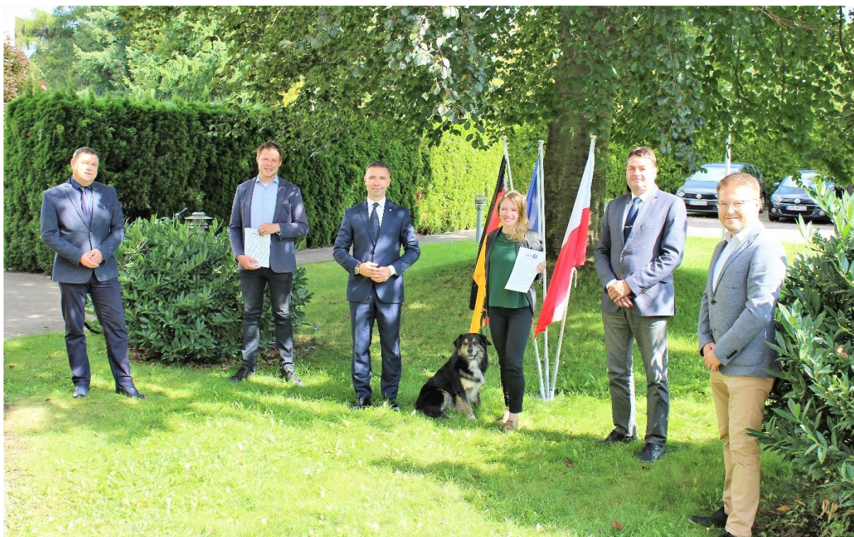
Nowo powstałe partnerstwo pomiędzy Fundacją I.N.A. Lieberoser Heide, gminą Schenkendöbern, Fundacją Naturlandschaften Brandenburg oraz Powiatem Krośnieńskim